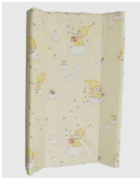
cod. P01 PVC rotocalco