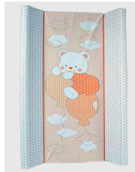
cod. P02 PVC stampa digitale