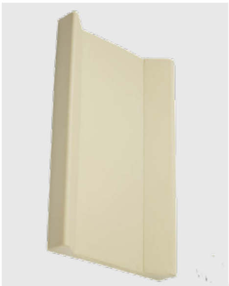
cod. P00 PVC tinta unita