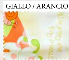
GIALLO / ARANCIO