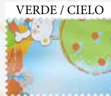
VERDE / CIELO