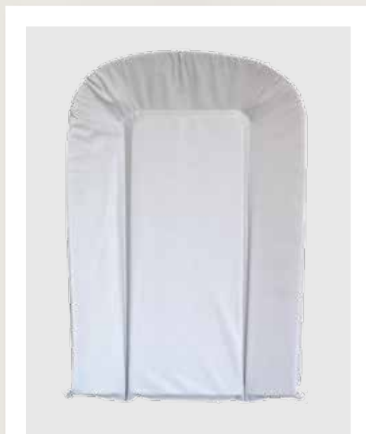
cod. P33 stampa rotocalco