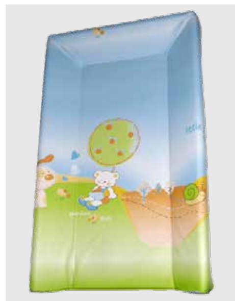
cod. P20 PVC rotocalco