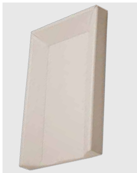
cod. P06 PVC tinta unita